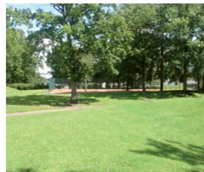
Parc de 12 hectares