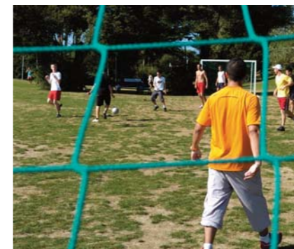
Animations sportives et culturelles, loisirs organisés.