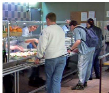
Restauration sur place